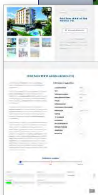
fac-simile Scheda dedicata

Scheda dedicata con: nome, località, categoria, foto, descrizione, servizi, offerte/last minute, richiesta diretta, maps di ricerca.